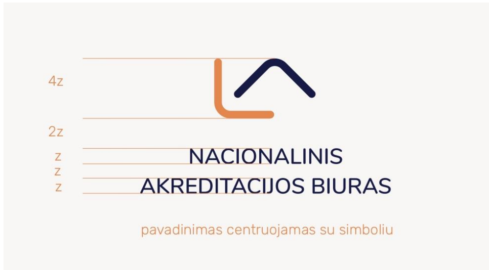
3 pav. Akreditacijos ženklo proporcijos

Vertikalus akreditacijos ženklas negali būti naudojamas mažesnis nei 20 mm aukščio, o horizontalus – 12 mm aukščio.