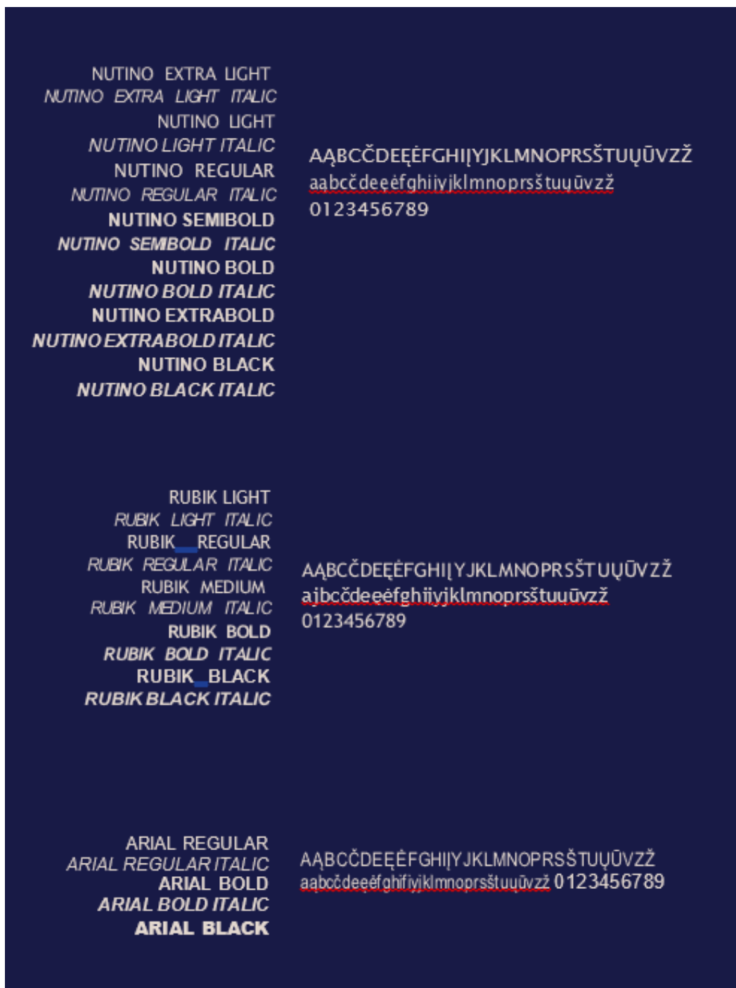
6 pav. Akreditacijos ženklo ir grafinės komunikacijos šriftai