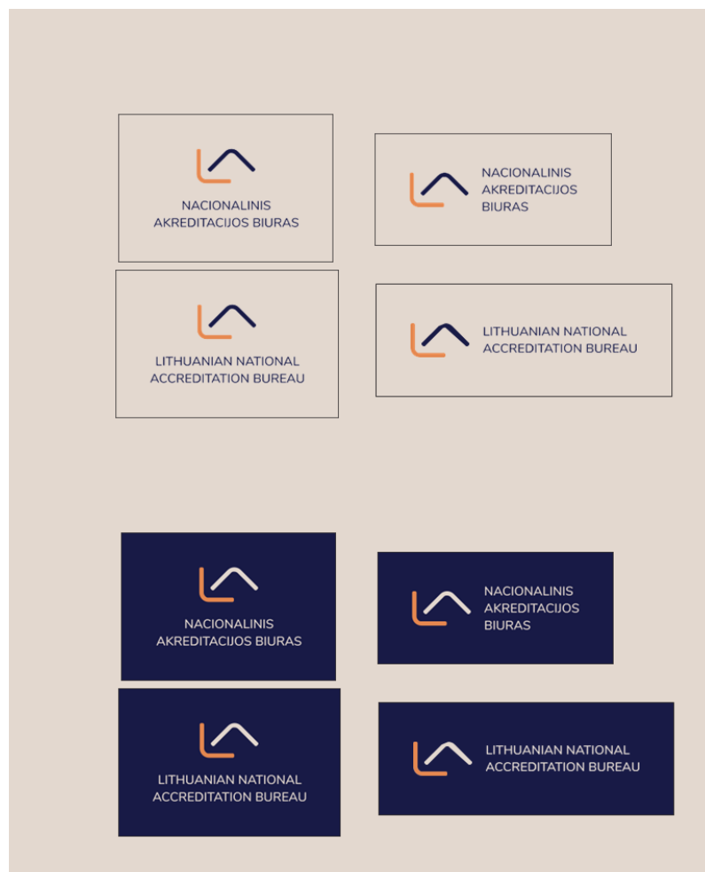
2 pav. Akreditacijos ženklo versijų pavyzdžiai