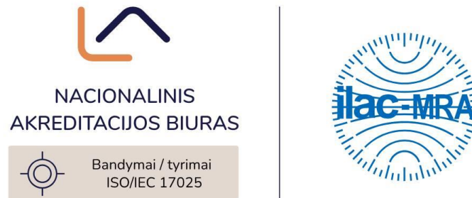
7 pav. Akreditacijos ženklo ir ILAC MRA ženklo derinio pavyzdys