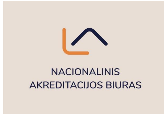
1 pav. Akreditacijos ženklas (pagrindinė versija)